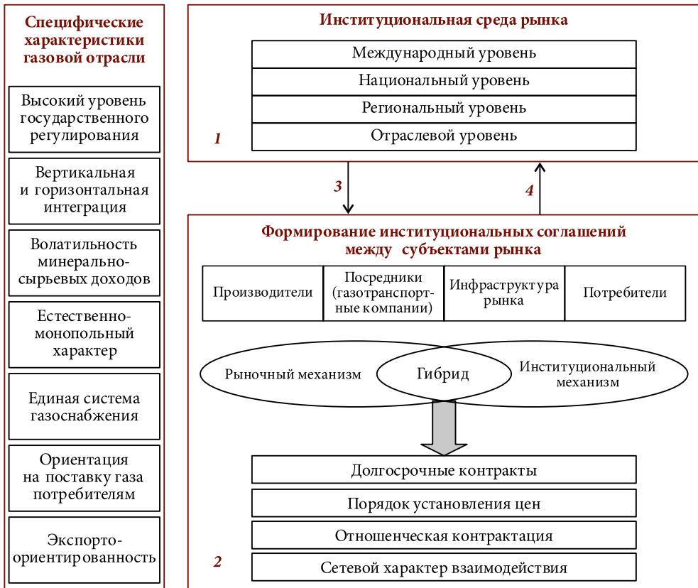
Рис. 2. Механизм взаимодействия субъектов рынка с ограниченной конкуренцией на примере рынка природного газа

Одним из методологических базисов, позволяющих систематизировать особенности организации товарного рынка, является схема рыночных институциональных взаимодействий О. Уильямсона [27], который предложил трехуровневую схему анализа рынка. Схема была модифицирована и адаптирована к целевым установкам настоящего исследования (рис. 2).