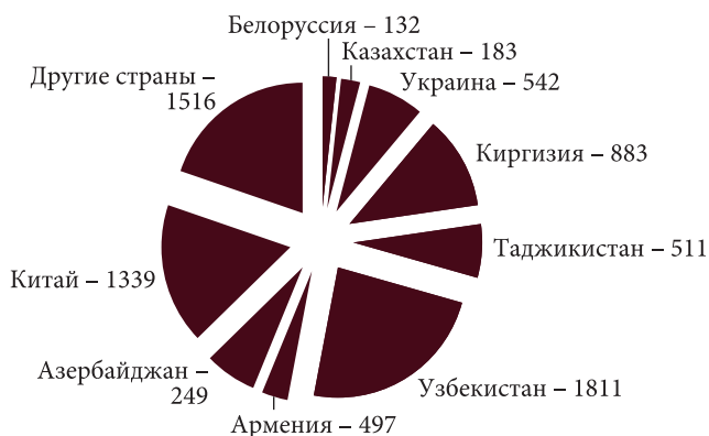
Рис. 3. Число иммигрантов, прибывших в Приморский край в 2011 г., чел. 1

Миграция оказывает влияние не только на численность населения края, но и на его качественную структуру (возрастно-половой состав, уровень образования и т. д.). Так, население высокого социального и профессионального уровня частично замещается мигрантами с низким образовательным уровнем и квалификацией, которые занимают преимущественно неквалифицированным трудом.